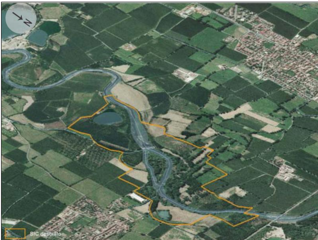
Figura-1-Inquadramento su foto aerea del perimetro del SIC IT20A0003